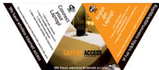
Quickguide til værelserne etc.