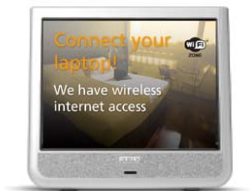
Informationskanal for lobbyområdet