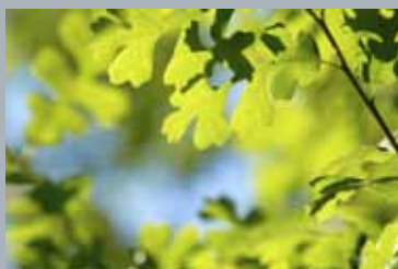
HPC 1000 – Energibesparingsystem