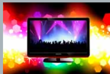
Entertainment – Film och tv-kanaler