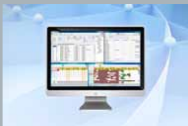
HotSoft – Bokningssystem