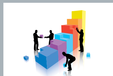
Leasing – Finansiering