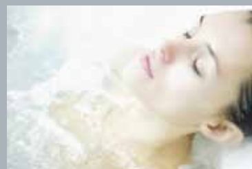
Comfort Design – Hotellinteriör