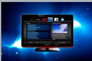
Eyecom – Moderna tv-lösningar