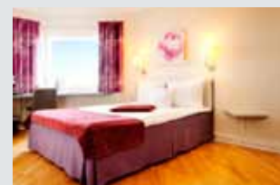
Quality Airport Hotel Arlanda, Stockholm. LED/LCD-tv, tv-stativ, digital huvudcentral och tv-kanaler.