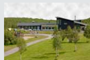
Camp Ripan, Kiruna. LED-tv, tv-stativ, digital huvudcentral, infokanal.