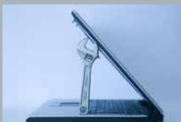
NL Partner – IT, service och support