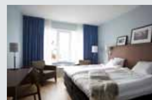
Marstrand's Havshotell, Marstrand. LED-tv, digital huvudcentral och infokanal.