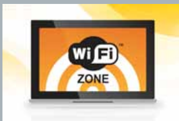
Laptop Access – Trådlöst Internet