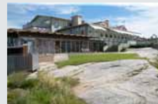
Smögens Havsbad, Smögen HotSoft.