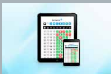
Serviator – Mobilt backoffice-system